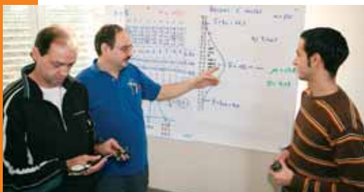
2009: Formazione per il controllo degli strumenti di misurazione. Un importante contributo per garantire la qualità è la verifica della precisione degli strumenti di controllo, per evitare misurazioni errate.

La crescita pronosticata del 1,6 per cento si è più che raddoppiata al 3,4 per cento. Da oggi a domani si riempiono i portafogli ordini, la flessibilità e la qualità una volta di più vengono ripagate, perché nel Gruppo Elbe la crescita è superiore al sessanta per cento. Così Gundream Elbe: "nei tempi difficili non abbiamo licenziato il nostro personale tradizionale, bensì lo abbiamo impiegato con scopi mirati, anche se qualche volta ha fatto un po' male finanziariamente al gruppo." Davanti alla crisi abbiamo acquisito nuovi clienti. Li abbiamo convinti con la nostra flessibilità, innovazione e produzione