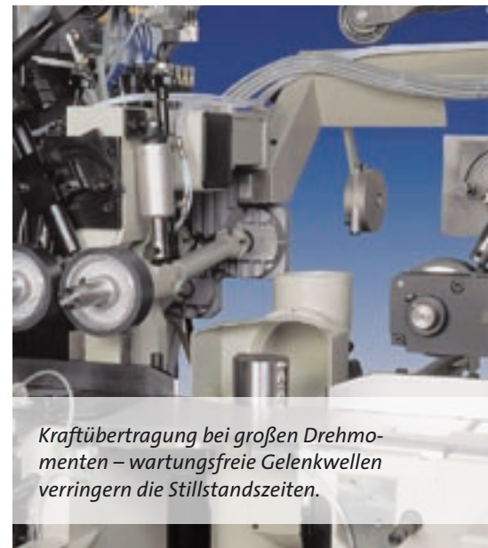
Kraftübertragung bei großen Drehmomenten – wartungsfreie Gelenkwellen verringern die Stillstandszeiten.